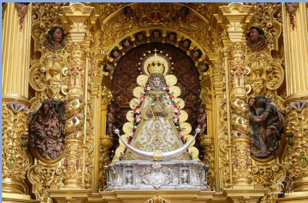
SANTUARIO DE LA VIRGEN DEL ROCIO EL ROCIO - ALMONTE